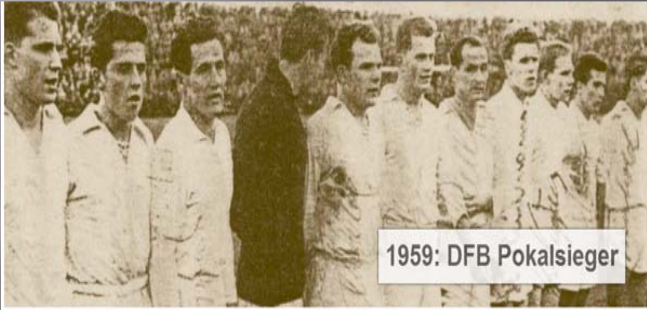
1959: DFB Pokalsieger